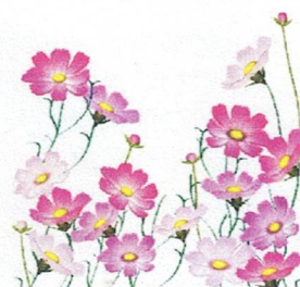
学校花壇の様子から