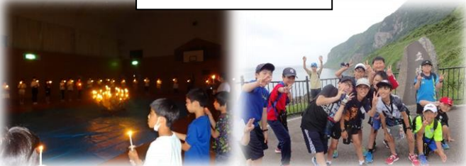
キャンドルファイヤー