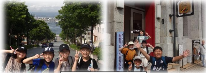
西部地区自主研修

6月29日、30日の2日日程で、宿泊研修が行われました。天候が心配されていたこの日、電停で降りるとともに大雨。折りたたみ傘が役に立ちました。しかし、自主研修がスタートしてすぐに晴れ、その後は雨に当たることなく予定通り実施することができました。その他、キャンドルファイヤーや自然散策など普段はできないような体験活動を通して、函館の歴史や自然の美しさに触れ、豊かな情操を養い、友達との絆を深めることができた素敵な2日間となりました。